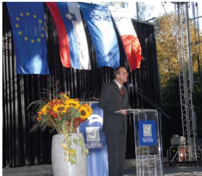
► »Mene pa opazijo, ker sem nov.«