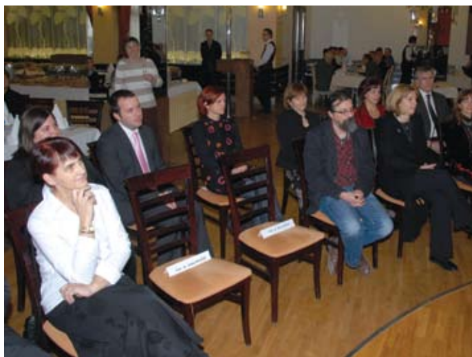
Svatba brez poročnega para?