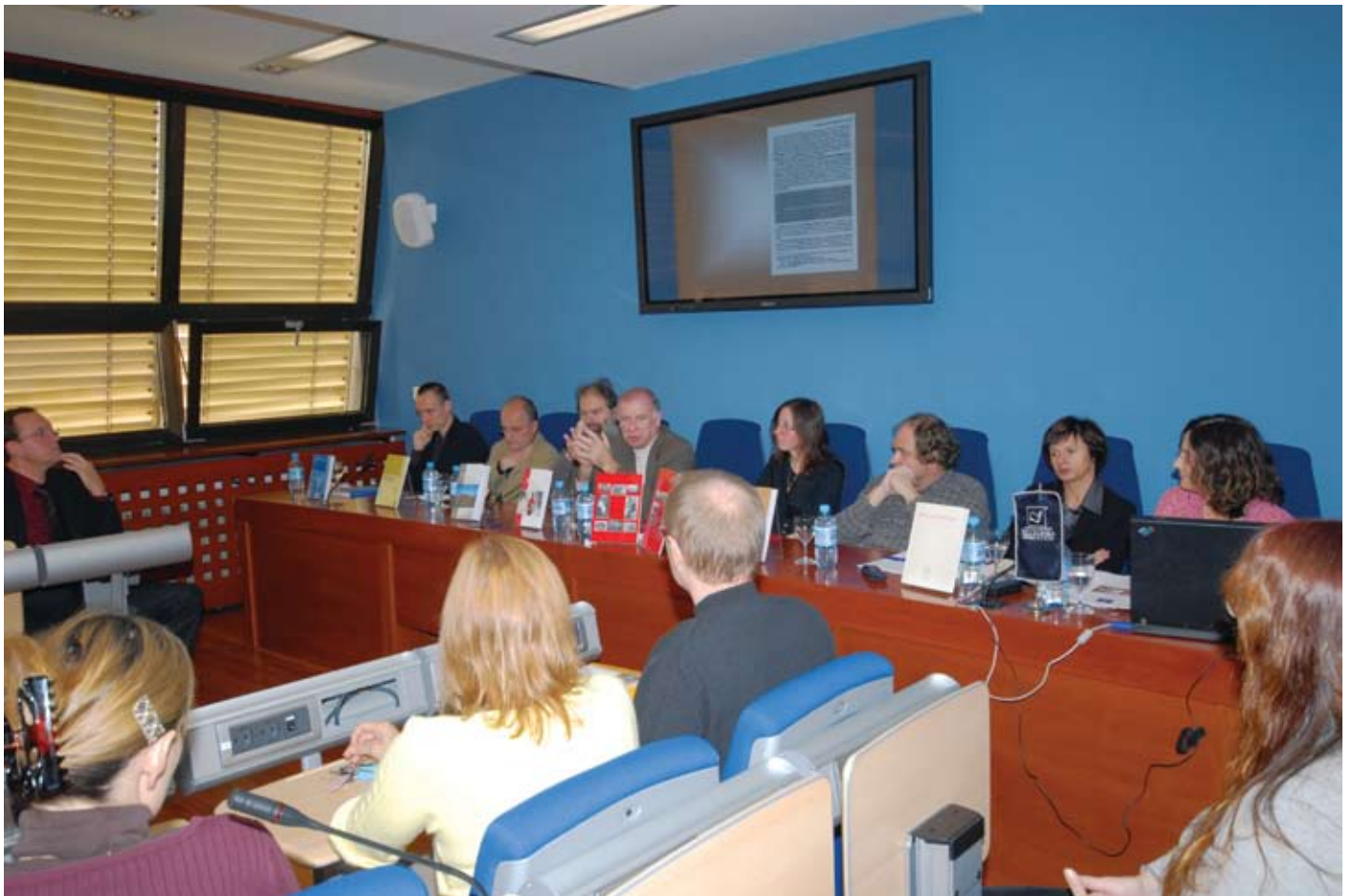
► Novembrska tiskovna konferenca