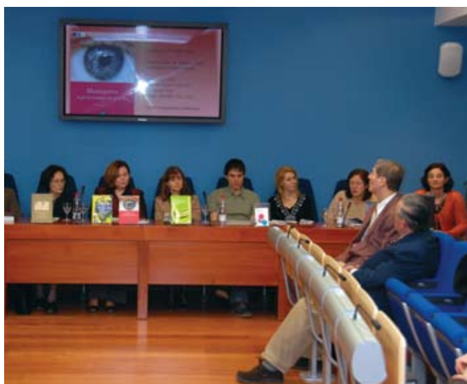
► Prvi tiskovni konferenci v »Modri sobi«