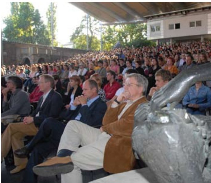
► »Joj, tako dolgo sem že tu, da me nihče več ne opazil«