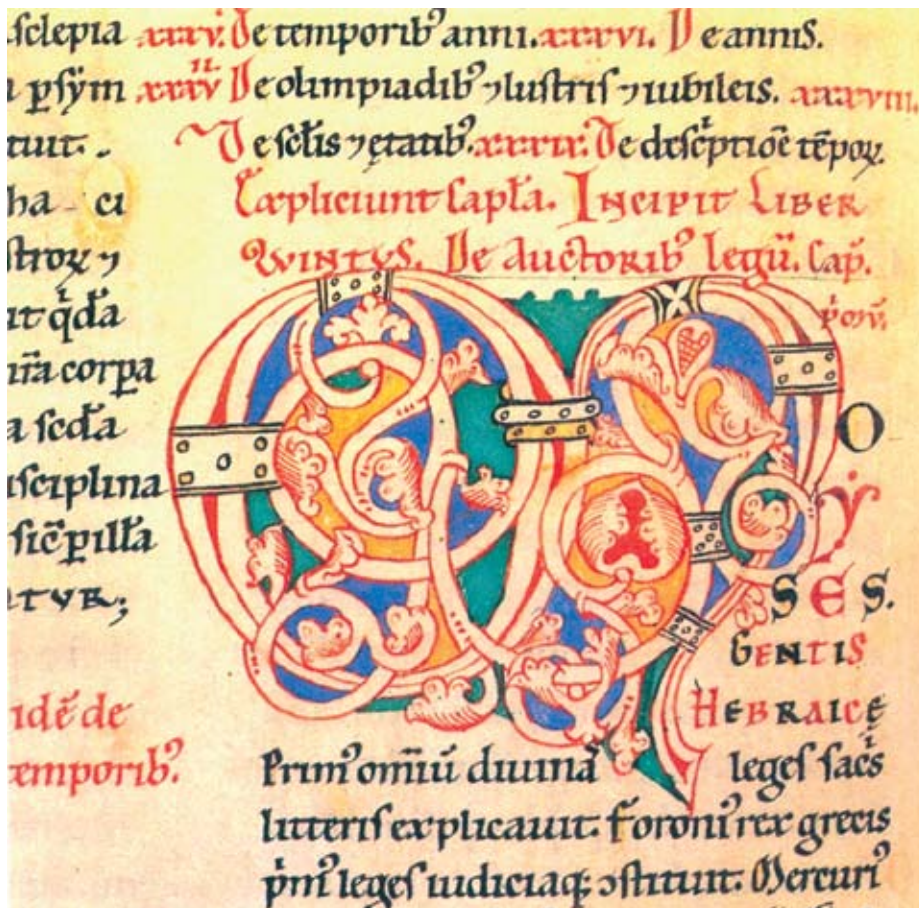
► M iz stiškega prepisa enciklopedije Izidorja iz Sevilje, NUK, Ms 16