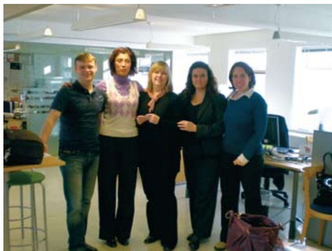
► Godar vinkonurl!