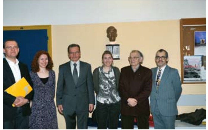
► Odpiramo novo študijsko smer, galeristiko. Vsako nadstropje bo imelo galerijo, v 4. je že kiparska, v 3. bo slikarska, v 2. bo na ogled grafično oblikovanje, v 1. industrijsko, v pritličju bodo plastinati, v kleti imamo tudi že dolgo časa instalacije, v... ne, dovolj je.