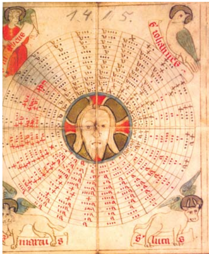
► Delček zložljivega koledarja, dolgega en meter, NUK, Ms 160