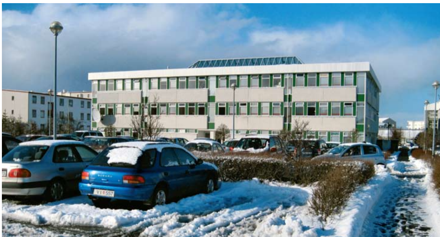
► Univerza Islandije v Reykjaviku, ko je bil sneg še bel.