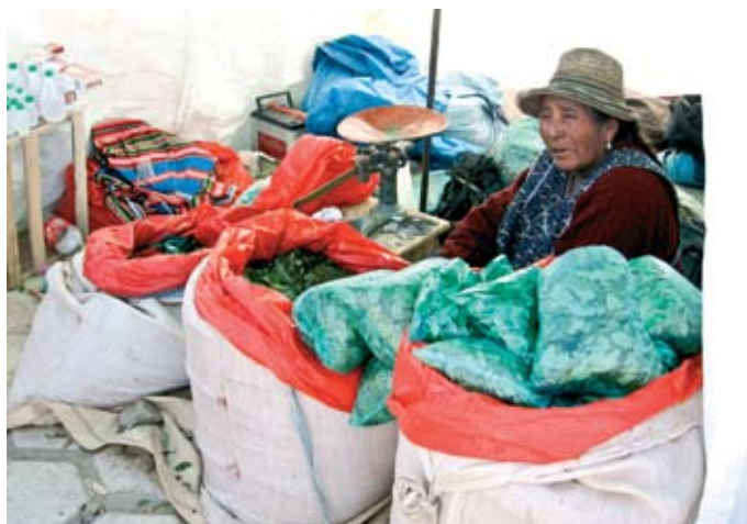
► Snif, snif...