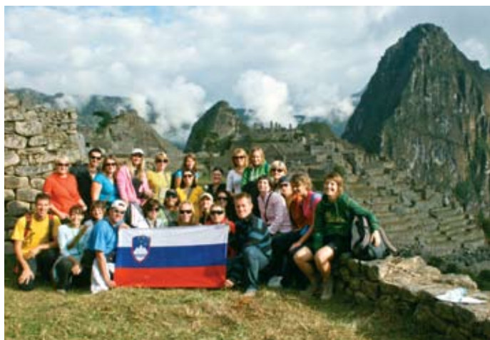
► Na eni izmed mnogih teras na Machu Picchu. (Če ste močno prehlajeni, potem tole ime raje izgovarjajte bolj potihno...)