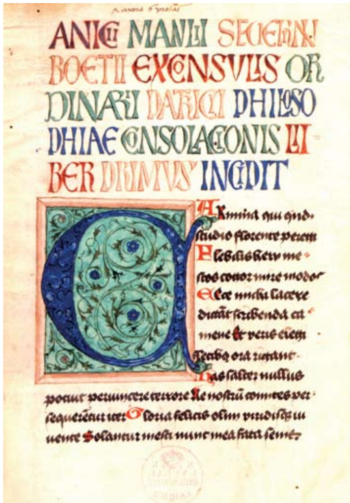
► Barvit začetek Boecijeve Tolažbe filozofije, NUK, Ms 51